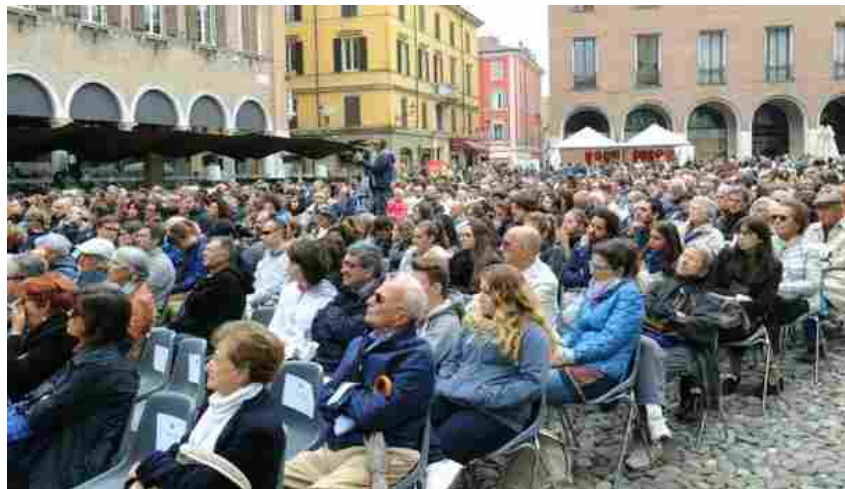
Il pubblico in piazza Grande

Manhattan Transfer, i campioni della voce